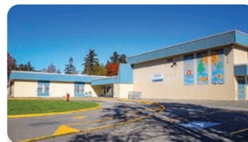
페블 힐 초등학교 학교 정원: 250명