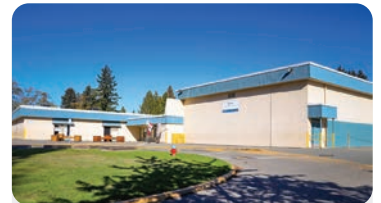
자비스 초등학교 학교 정원: 450명