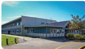
라드너 초등학교 학교 정원: 450명