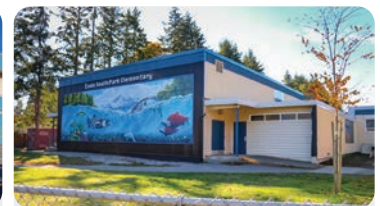
사우스 파크 초등학교 학교 정원: 400명