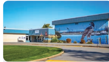
호손 초등학교 학교 정원: 450명