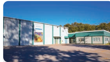
비치 그로브 초등학교 학교 정원: 300명