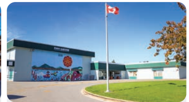
포트 기숀 초등학교 학교 정원: 175명