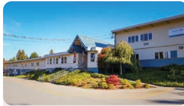
애니빌 초등학교 학교 정원: 280명