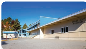
잉글리시 블러프 초등학교 학교 정원: 200명