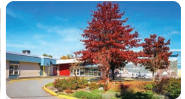
킵슨 초등학교 학교 정원: 400명