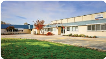
차머스 초등학교 학교 정원: 475명