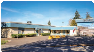
그레이 초등학교 학교 정원: 500명