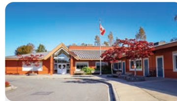
닐슨 그로브 초등학교 학교 정원: 175명