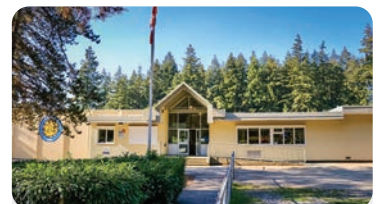
선샤인 힐스 초등학교 학교 정원: 500명