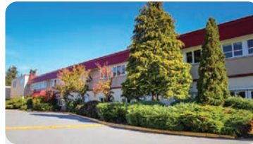
데본 가든 초등학교 학교 정원: 350명