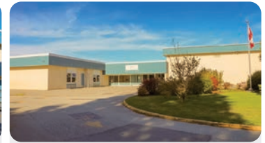
홀리 초등학교 학교 정원: 350명