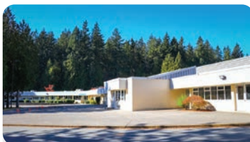
파인우드 초등학교 학교 정원: 300명