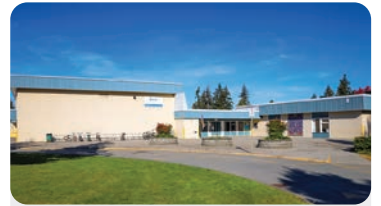
브룩 초등학교 학교 정원: 300명