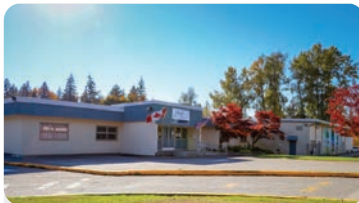
히스 초등학교 학교 정원: 225명