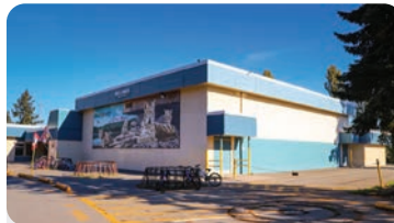
헬름스 초등학교 학교 정원: 300명