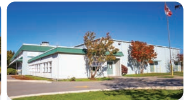
클리프 드라이브 초등학교 학교 정원: 300명